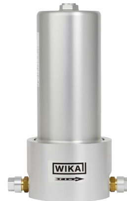
Unidade portátil de filtro SF 6 , modelo GPF-10